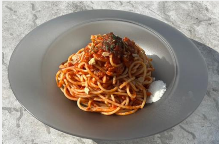
Tomato Sauce Pasta with Soybean Meat ※For vegetarians