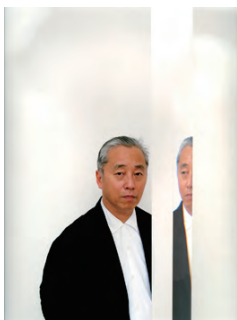
杉本博司（現代美術作家） Hiroshi Sugimoto