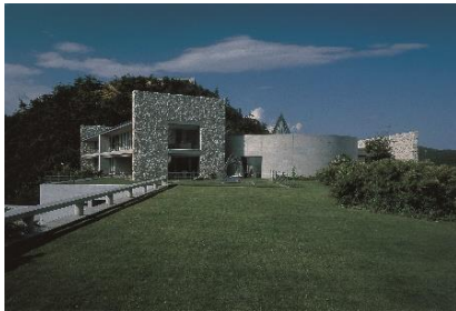
ベネッセハウス