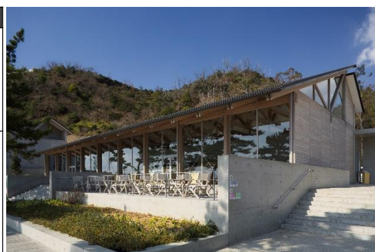
ベネッセハウス テラスレストラン

船の欠航など、安全かつ円滑な旅行の実施が見込めない場合は、旅行を中止または変更する場合がありますのでご了承ください。