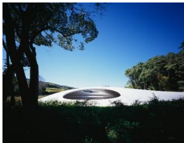
豊島美術館