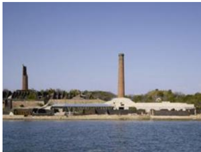
犬島精錬所美術館