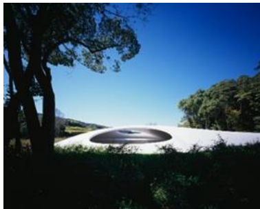
豊島美術館