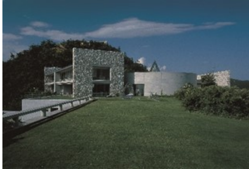
ベネッセハウス