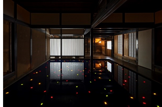
家プロジェクト「角屋」宮島達男「Sea of Time '98」