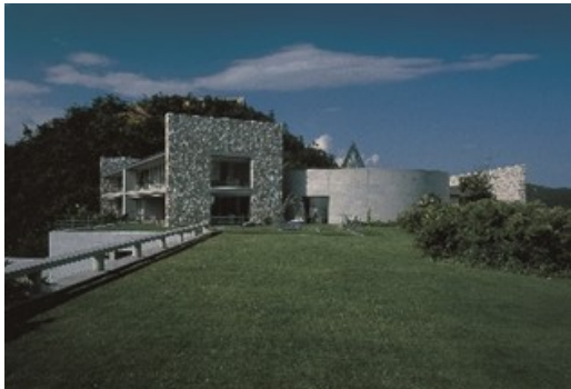
ベネッセハウス