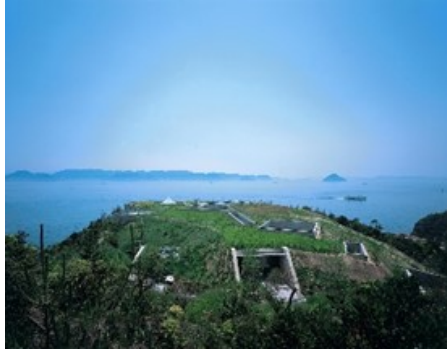
地中美術館

「地中美術館」や「ベネッセハウス ミュージアム」など直島の代表的な美術施設をベネッセアートサイト直島のスタッフがご案内いたします。