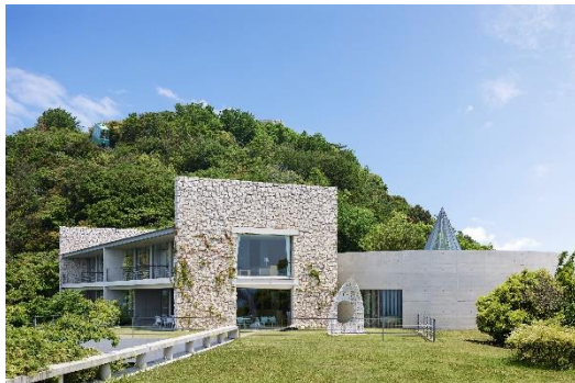
ベネッセハウス ミュージアム