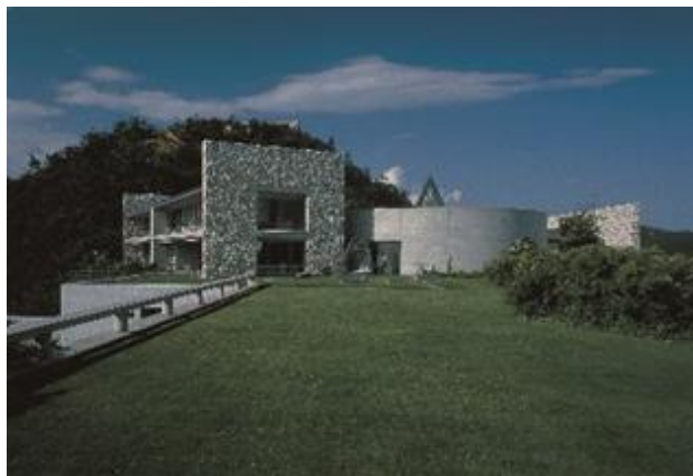
ベネッセハウス