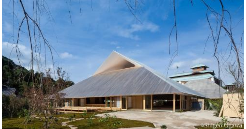
直島ホール 所有者：直島町 設計：三分一博志建築設計事務所