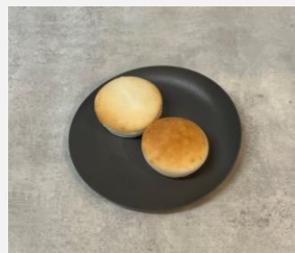
Rice flour bread for gluten-free 米粉パングルテンフリー対応 ¥ 500