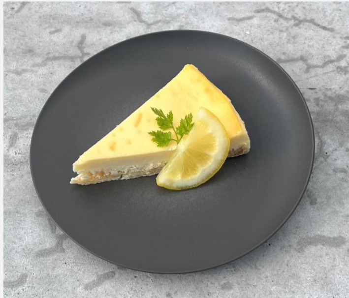
Cheesecake with homemade marinated lemon チーズケーキ 自家製シロップ漬けレモンを添えて ¥750