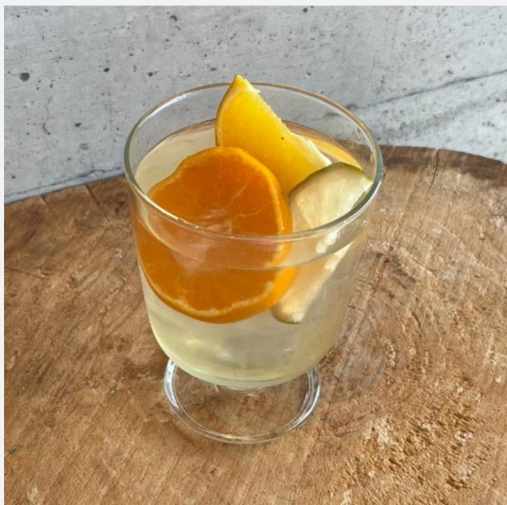
Homemade SETO-PON (Hot/Iced/Soda) 自家製シロップジュース せとぼん ¥750

瀬戸内レモンと季節のハーブを蜂蜜にたっぷり漬けて作る、当店自家製レモネード 蜂蜜を使用しておりますので1歳未満の乳児には与えない様ご注意ください。 Made with lemons from Setouchi and seasonal herbs marinated in honey. This product contains honey. Please be careful not to give it to infants under 1 year old.