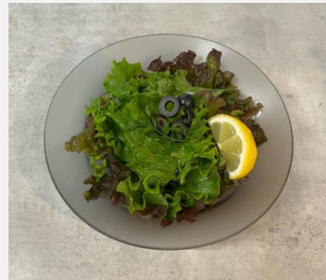
Salad with black olive ブラックオリーブサラダ ¥ 700