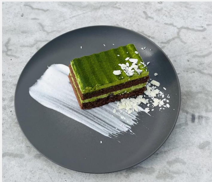
Matcha cake 抹茶ケーキ ¥750

For your safety, please kindly refrain from eating and driving. ラム酒を使用しておりますのでお車でお越しのお客様はご遠慮ください。