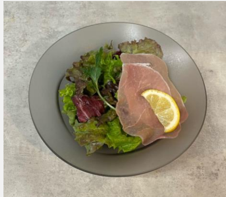
Salad with prosciutto 生ハムサラダ ¥ 750