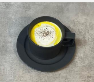
Pumpkin soup 南瓜のスープ ¥ 650