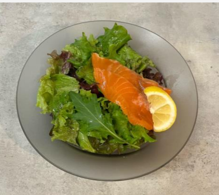
Salad with smoked salmon スモークサーモンサラダ ¥ 750

ベネッセハウスオリジナルオーガニックオリーブオイルと塩・胡椒でシンプルに仕上げました。