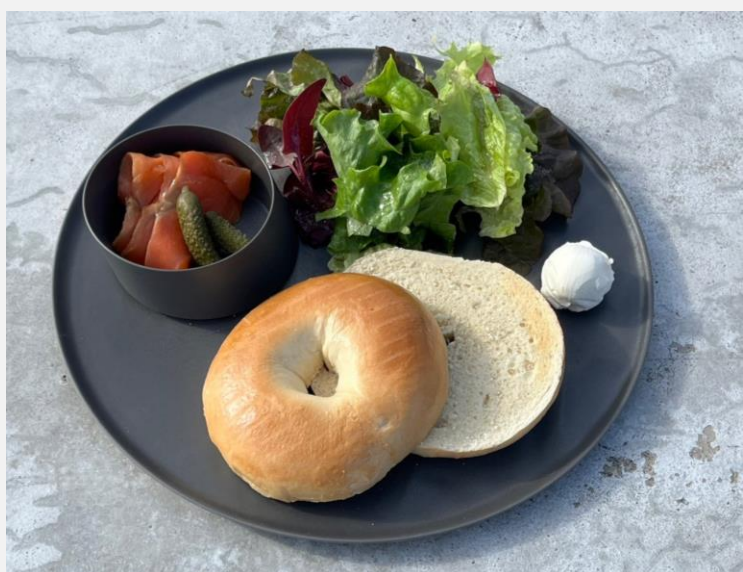
Bagel with Smoked Salmon, Cream Cheese and Green Salad