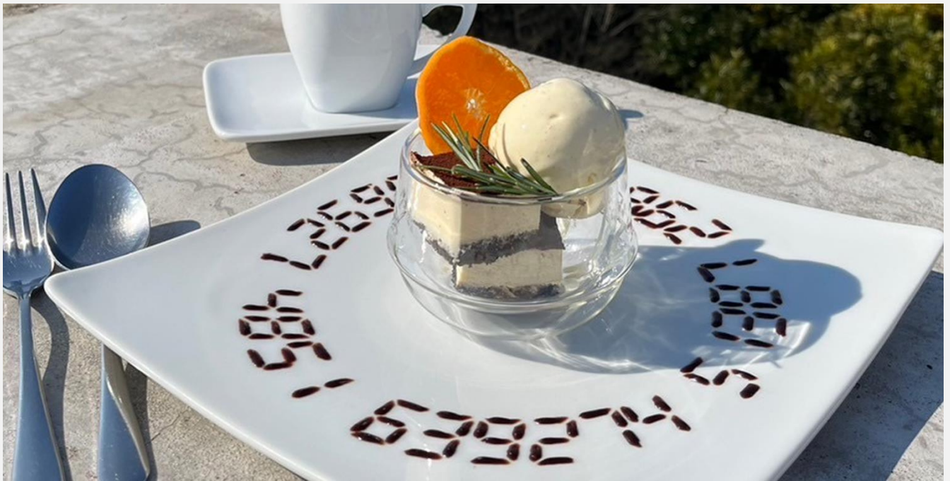
Tiramisu & Vanilla Ice Cream with homemade marinated fruits