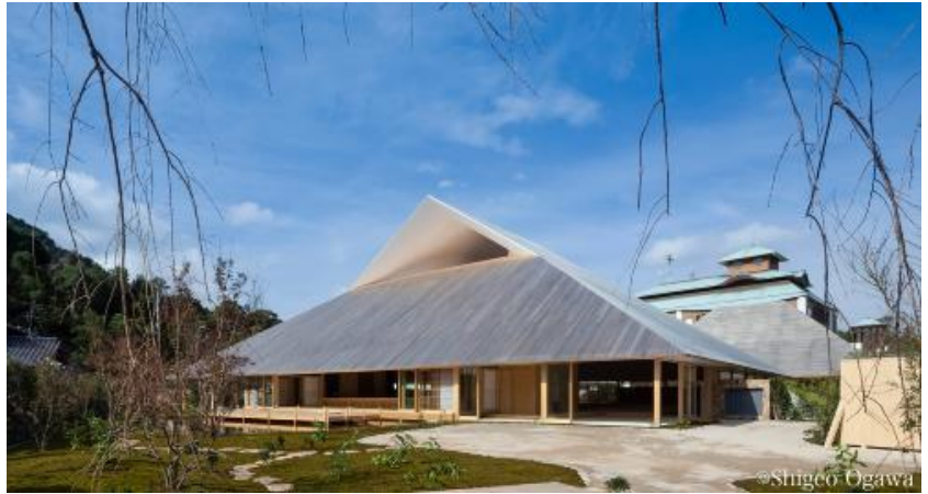
直島ホール 所有者：直島町 設計：三分一博志建築設計事務所