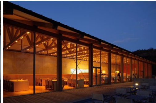
ベネッセハウステラスレストラン