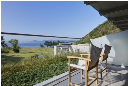
ベネッセハウスパーク