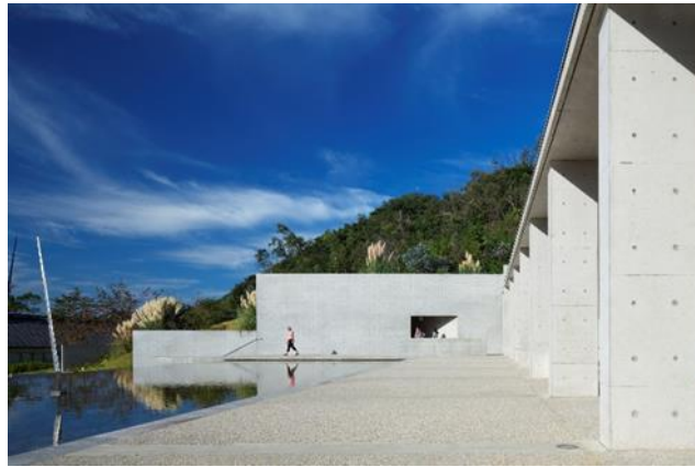
地中美術館