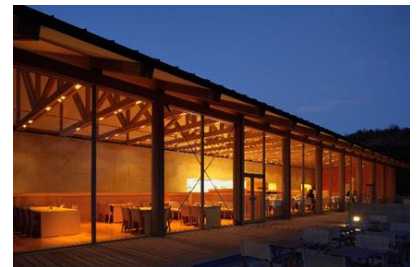
ベネッセハウス テラスレストラン

船の欠航など、安全かつ円滑な旅行の実施が見込めない場合は、旅行を中止または変更する場合がありますのでご了承ください。