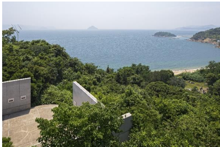
ベネッセハウス ミュージアム