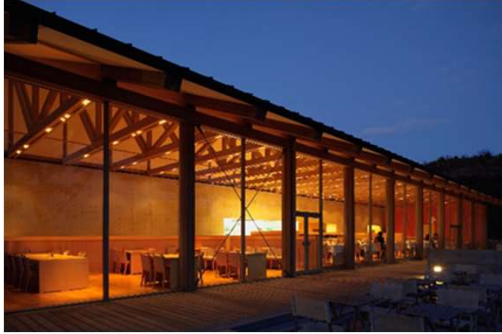
ベネッセハウス テラスレストラン