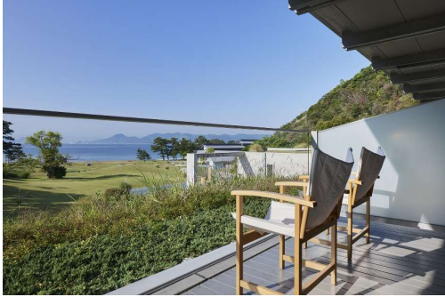
ベネッセハウスパーク