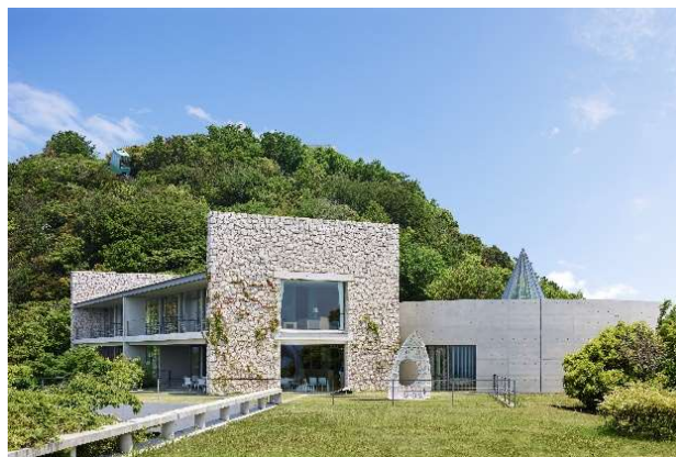
ベネッセハウスミュージアム