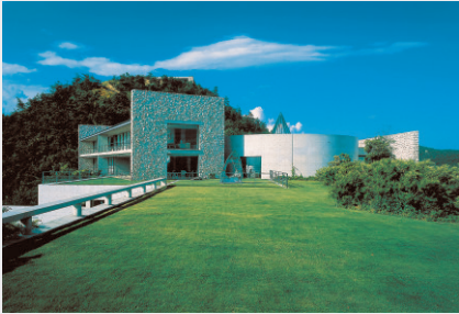
ベネッセハウス ミュージアム Benesse House Museum