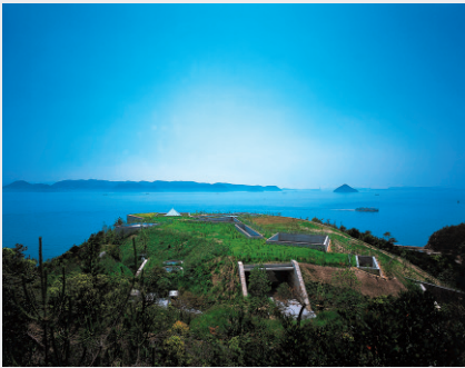
地中美術館 Chichu Art Museum