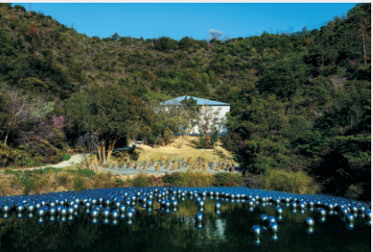
ヴァレーギャラリー Valley Gallery