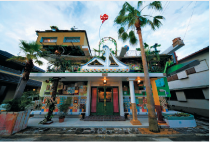
大竹伸朗 直島銭湯「I♥湯」（2009） Shinro Ohtake, Naoshima Bath “I ♥ 湯 ”