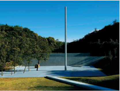
李禹煥美術館 Lee Ufan Museum