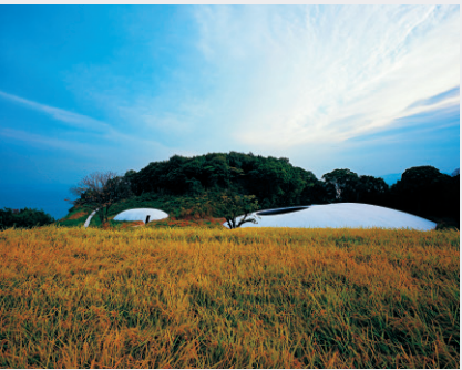
豊島美術館 Teshima Art Museum