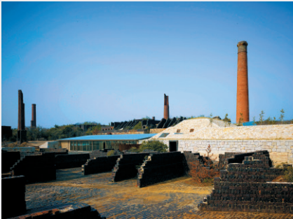
犬島精錬所美術館 Inujima Seirensho Art Museum