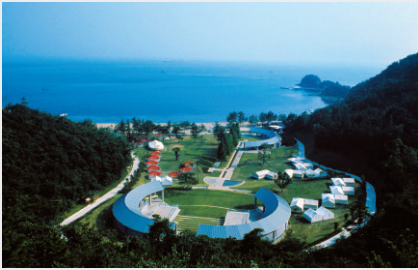
直島国際キャンプ場 Naoshima International Camping Ground