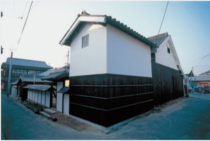
家プロジェクト「角屋」 Art House Project “Kadoya”