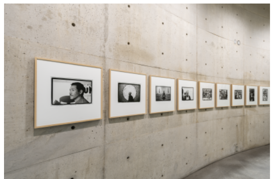
安齊重男《ベネッセハウスアーティスト写真》展示風景

70年代より日本の現代アートの現場を長年にわたり記録撮影してきた安齊重男によるベネッセアートサイト直島ゆかりのアーティストたちのポートレイトを展示します。実際にアーティストが直島を訪れた際に撮影されたものや、日本訪問時の様子をとらえた貴重なポートレイトです。