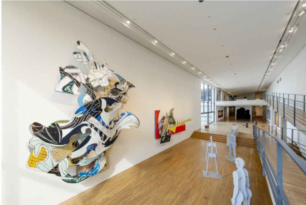
ベネッセハウス ミュージアム展示風景

ベネッセハウス ミュージアム(香川県・直島)では展示替えを新たに行い、2025年2月6日(木)より公開します。