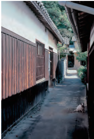
本村風景