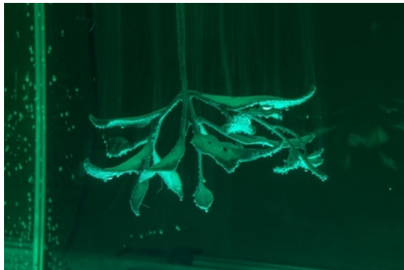
左：展示風景「Kei Imazu: The Sea is Barely Wrinkled」Museum MACAN（ジャカルタ）2025年、Photo courtesy Liandro Siringoringo 右：バグース・パンデガ《Anim Wraksa》2025年、Photo: Daniel Pérez, courtesy of Swiss Institute

今津景 1980年山口県生まれ。バンドン（インドネシア）を拠点に活動。インターネット時代の膨大な画像アーカイブを掘り起こし、断片化したデジタル空間を考古学的に再構成する。リサーチを基盤に3Dレンダリングやデジタルスケッチを用いて下絵を組み立て、CGIやUnreal Engine、3Dプリントも導入しつつ、直感と身体感覚に根ざした絵画を展開。2018年のインドネシア移住以降は、群島部の神話・口承と多層的な植民地史、日本の戦時関与を層々の領域として扱い、近年は東京オペラシティアートギャラリーやMuseum MACANでの個展を通じて、映像・彫刻・没入型インスタレーションへと表現を拡張している。