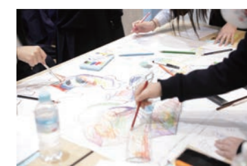
高等学校の研修プログラムツアー例