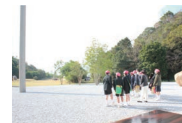
小学校の研修プログラムツアー例