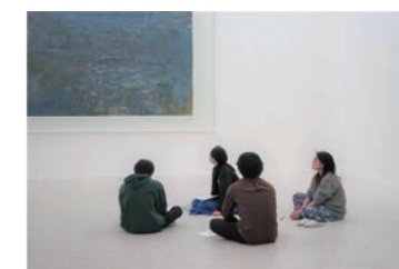
社会人向けの研修プログラムツアー例