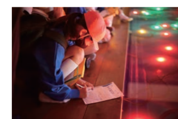
小学校の研修プログラムツアー例