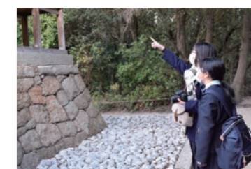
高等学校の研修プログラムツアー例