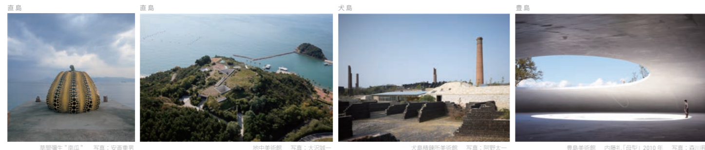
直島 草間彌生「南瓜」

ベネッセアートサイト直島は、瀬戸内海の島々でアートプロジェクトを展開している活動の総称です。アートを鑑賞していただくことだけでなく、日常の喧騒から離れた島という環境で普段とは違う時間の流れの中でアートと向き合い、自分にとっての「ベネッセ=よく生きる」とは何かを考えていただく場になることを目指しています。そのために、自由な解釈を導く現代アートを中心に、自然・建築・歴史・文化・人々の営みなど周りの環境と豊かな関係性を感じられる作品が選ばれており、アーティストがそれぞれの場に合わせた構想し滞在制作したものが多くあります。アート作品は様々な場所に点在しており、歩くこと、眠ること、考えること、すべてが鑑賞体験に繋がっています。