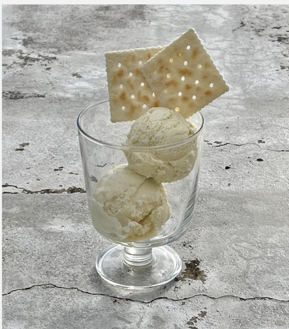
Vanilla Ice Cream