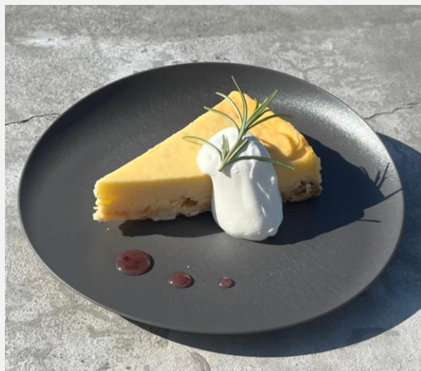
Cheesecake with berry sauce