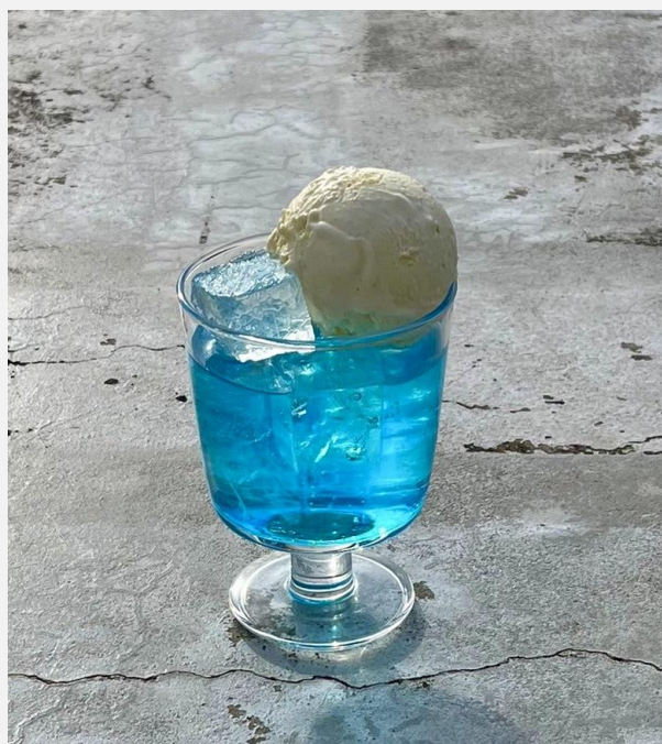
Sora-Iro Cola Float