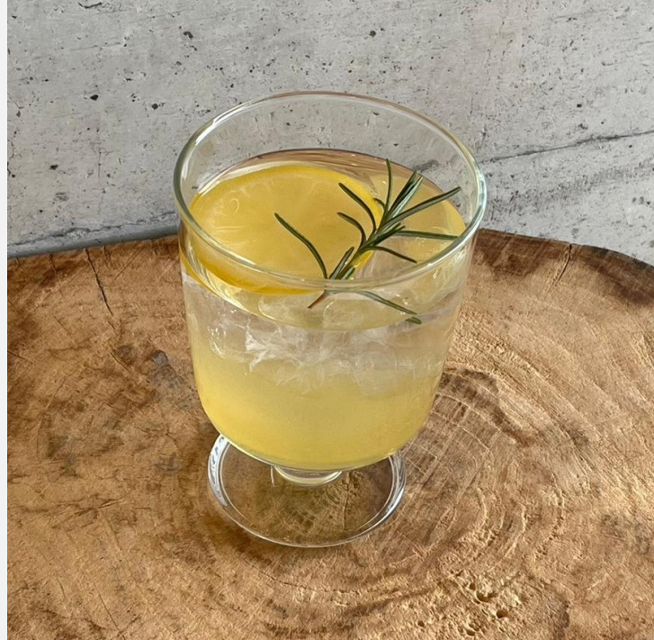
Homemade Lemonade (Hot/Iced/Soda)

For your safety, please kindly refrain from drinking and driving.