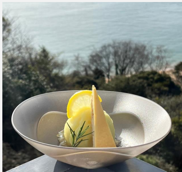
Lemon Sorbet & Cheesecake with Setouchi Lemon Jam