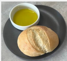
Bread with Olive Oil