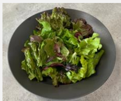
Salad with Lemon Dressing