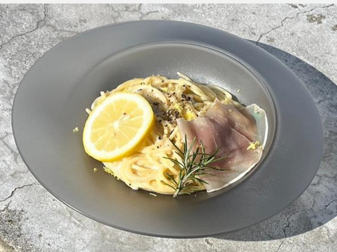
Setouchi Lemon Cream Pasta with Prosciutto