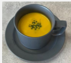
Cold Pumpkin Soup