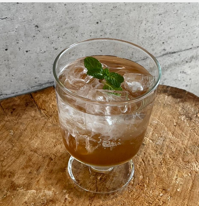
Homemade Ginger Ale