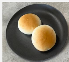
Rice flour bread