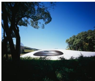
豊島美術館