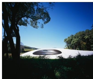
豊島美術館