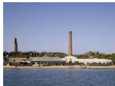
犬島精錬所美術館