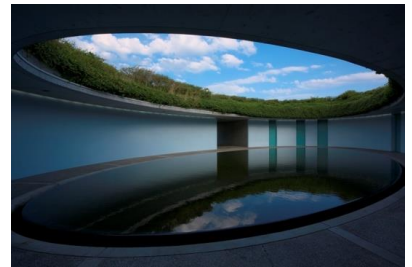
ベネッセハウス オーバル

★おすすめポイント ベネッセハウス オーバル特別見学 (客室等の宿泊エリアはご覧いただけません。) 混雑時でも入館保証(南寺、李禹煥美術館、地中美術館) ※館内の各作品スペースで待ち時間が発生する場合があります。