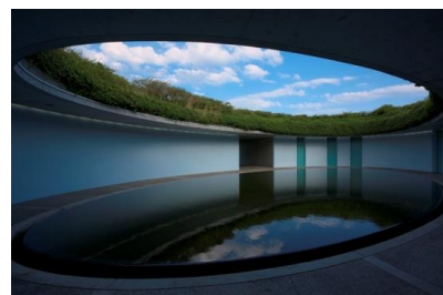
ベネッセハウス オーバル

★おすすめポイント ベネッセハウス オーバル特別見学 (客室等の宿泊エリアはご覧いただけません。) 混雑時でも入館保証(南寺、李禹煥美術館、地中美術館)