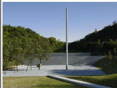
李禹煥美術館

船の欠航など、安全かつ円滑な旅行の実施が見込めない場合は、旅行を中止または変更する場合がありますのでご了承ください。