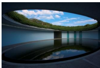
ベネッセハウス オーバル