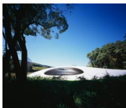
豊島美術館