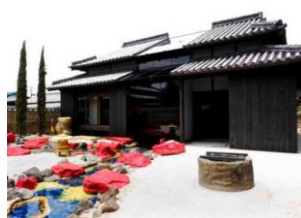
豊島横尾館